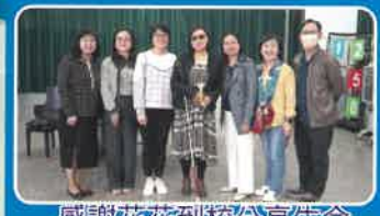
感謝花花到校分享生命