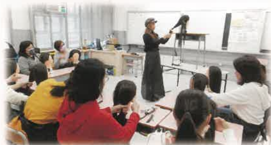
個人護理教室：剪髮班