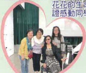
義工姨姨與花花拍照留念