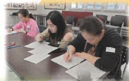
家長認真地進行練習