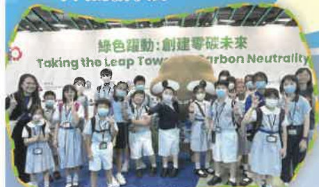
「國際環保博覽」及環保署綠色設施導賞團