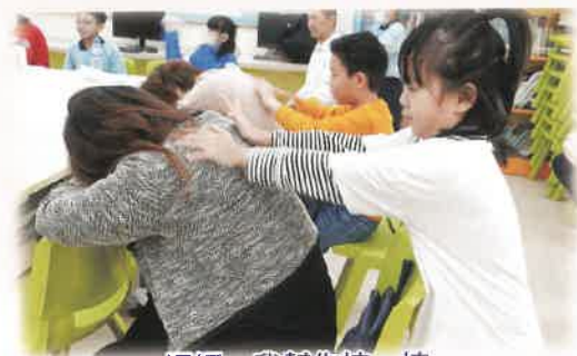
媽媽，我幫你按一按。