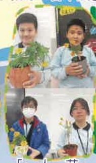
「一人一花」學生種植成果