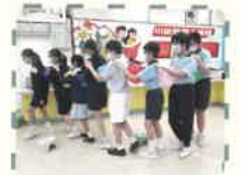
同學們投入玩遊戲