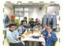
大家開心分享食物