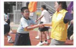
家長義工積極參與親子賽事