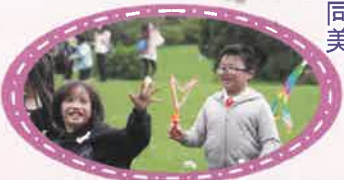
同學們都展露燦爛的笑容