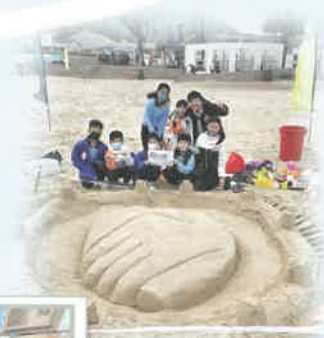
堆沙活動令同學們大開眼界