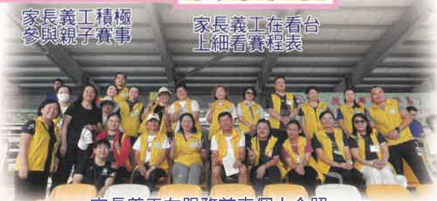
家長義工在服務前來個大合照