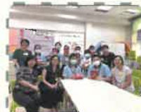
同學們團契大合照

學生團契是一個充滿愛的活動，聖經告訴我們：「我們愛因為神先愛我們」（約翰一書四章19節），盼望團契的同學們能夠帶着這份愛去祝福身邊人。