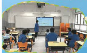
數學大使交流示範不同的教學法