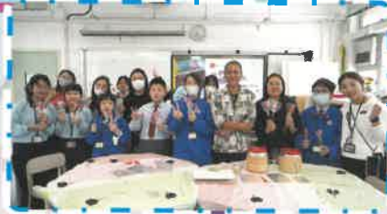
藝術大師令學生大開眼界

從相片可看到學生每次活動都非常投入，老師們最希望學生能享受其中，透過多元化活動快樂地學習，拓闊興趣，充份享受「喜·樂」的校園生活！