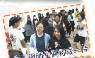
家長與師生們打成一片