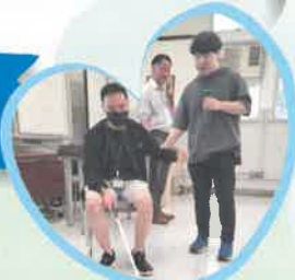
教師真實體驗失明人士的困難