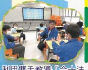
利用雙手教導「合十法」