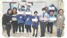
學生團契活動充滿愛