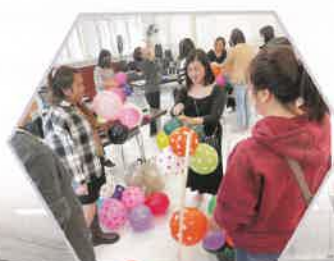
家長專心地學習如何製作氣球佈置——互相合作揀氣球