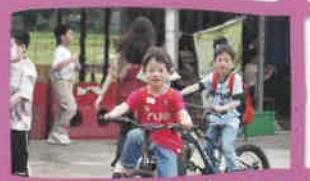
小朋友享受騎自行車的樂趣