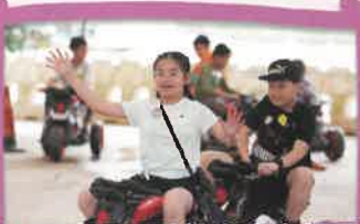
看！我們的駕駛技術多高超啊！