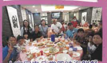
大家回來品嚐風味海鮮餐