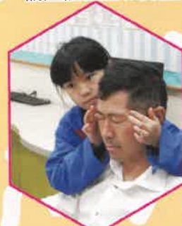
爸爸，你覺得舒服嗎？