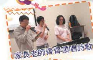
家長老師齊齊領唱詩歌