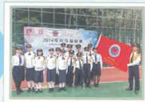
升旗隊參與大型檢閱禮