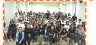
福音晚會氣氛既溫馨，又熱鬧