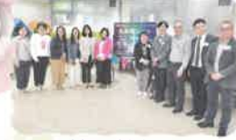
義工姨姨與一眾嘉賓大合照