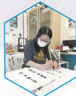
為開放日作品搜集資料 家長努力預備開放日作品