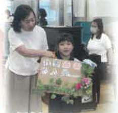
穌穌Club週會學習感恩