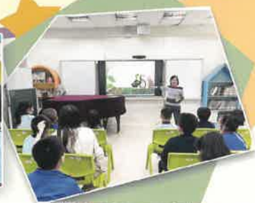
家長義工投入分享故事