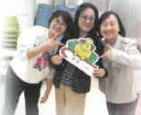
義工姨姨生命充滿喜樂