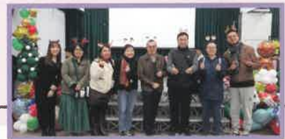
家教會的家長委員大合照