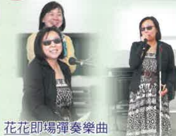
花花即場彈奏樂曲