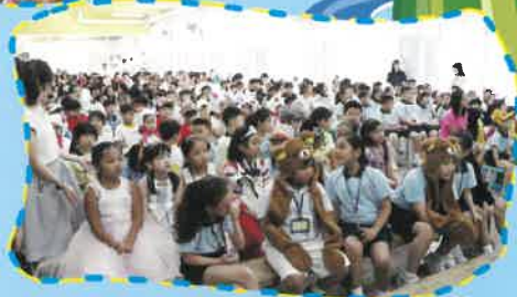
立體圖書演活大賽