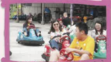
師生盡情玩碰碰車