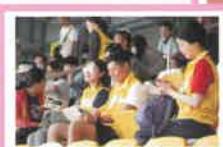
家長義工在看台上細看賽程表