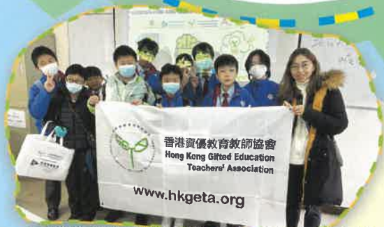
「深港澳資優邏輯比賽2023」參賽同學合照

「喜樂滿校園」正是我們學校數學和常識科教學的一個生動寫照。透過校內外的活動和比賽，同學們不僅學到知識，還培養解決問題的能力、合作精神和創新思維。讓我們共同努力，讓學習的喜悅和樂趣在我們的校園裡繼續綻放！