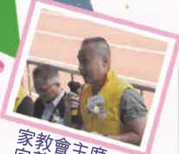
家教會主席向義工致謝

2023年11月3日校運會當天共有20位家長參加的義工服務。他們主要協助擲壘球、跳遠、召集、看台及司令台秩序等工作，表現落力，令賽事更順利進行。此外，家長們積極參加親子賽事，令氣氛變得更熱鬧。