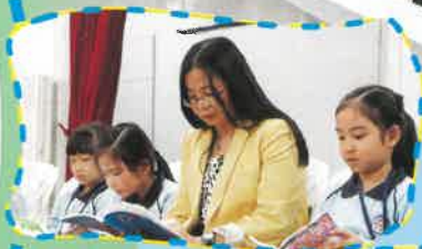
鄭校長與同學們專心享受閱讀樂趣