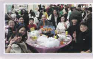
家長學生積極參與