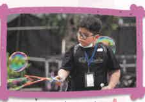
同學弄出美麗的泡泡來

2024年4月28日親子旅行當天共有215報名參加。當天行程緊密，包括到美味棧、錦田鄉村俱樂部、流浮山海味街及大埔海濱公園等，節目非常豐富。學校準備了小風箏及吹泡泡玩具供參加家庭玩樂，氣氛相當熱鬧，大家盡興而歸。