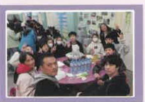
校友們共聚快樂時光