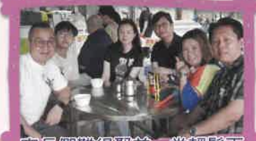
家長們難得聚首一堂輕鬆下