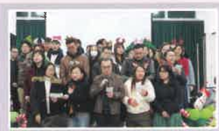
家長教師齊齊獻唱

2023年12月21日周年大會暨聖誕盆菜宴當天共有280人參加。在學校禮堂延開23席，有不少校友及其親屬參加，場面相當熱鬧。當晚共有18隊才藝表演，表演十分精彩；此外，還有抽獎環節，獎品非常豐富。