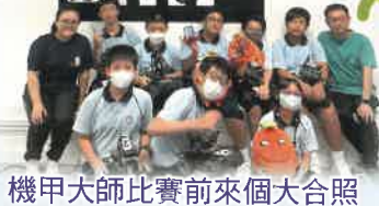
機甲大師比賽前來個大合照