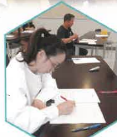
家長投入讀寫訓練工作坊