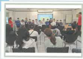
P4成長的天空啟動禮