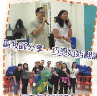
區牧師分享，巧恩姐姐翻譯