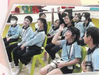
同學們專心聆聽故事

本年度共進行了10次故事爸媽的義工服務，每位家長義工於指定日期到校為同學分享故事。他們以大型故事書或電子書作教材，運用靈活的表達手法，例如角色扮演、有趣的提問、獎品等，吸引同學參與。活動後，同學們的反應踴躍，部分更到圖書館借閱相關圖書以回味故事。