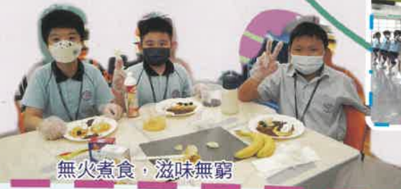
無火煮食，滋味無窮