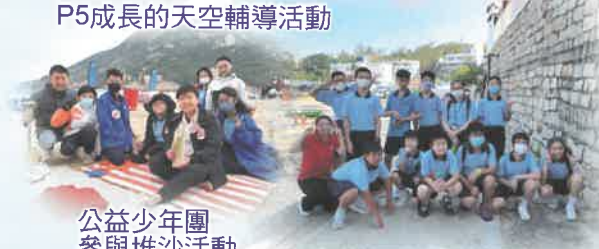
公益少年團參與堆沙活動