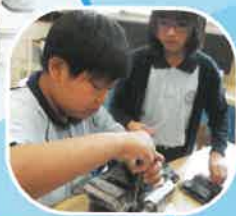
同學自行組裝機械車