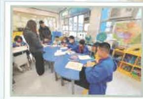
P5成長的天空輔導活動