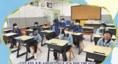
同學積極參與發問環節