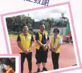
家長義工努力協助賽事的進行