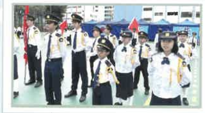
升旗隊隊員個個精神奕奕

「升旗隊」：本年度有21位隊員接受正規的升旗訓練。學校不但邀請外間專業機構到校訓練隊員，還為隊員提供制服，更推薦優秀隊員出外比賽。